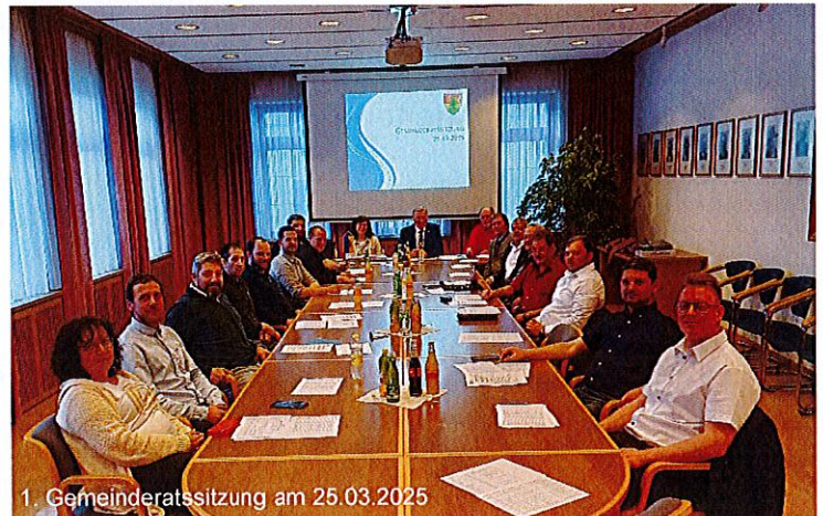
1. Gemeinderatssitzung am 25.03.2025

Die Kontakte der einzelnen Gemeinderäte finden Sie auch auf der Gemeindehomepage ( www.arbesbach.at ).